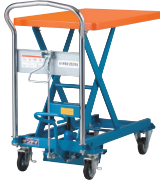
250kg 腳踏昇降車 UDL-250

最大載重量 / 250kg 車台面積 / 500 x 800mm 車台昇降(最高~最低) / 245~810mm