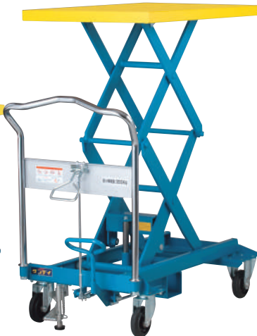
350kg 腳踏昇降車 UDA-350W

最大載重量 / 500kg 車台面積 / 600 x 910mm 車台昇降(最高~最低) / 300~930mm