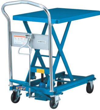
150kg 腳踏昇降車 UDL-150

最大載重量 / 150kg 車台面積 / 450 x 710mm 車台昇降(最高~最低) / 210~735mm