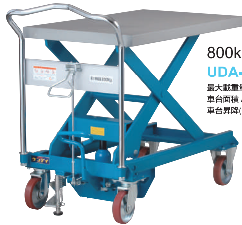
800kg 腳踏昇降車 UDA-800

最大載重量 / 800kg 車台面積 / 600 x 1000mm 車台昇降(最高~最低) / 330~1020mm