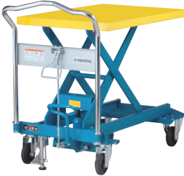
500kg 腳踏昇降車 UDA-500

最大載重量 / 500kg 車台面積 / 600 x 910mm 車台昇降(最高~最低) / 300~930mm