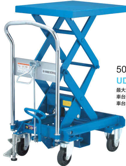
500kg 腳踏昇降車 UDS-500W

最大載重量 / 500kg 車台面積 / 500 x 600mm 車台昇降(最高~最低) / 345~1000mm